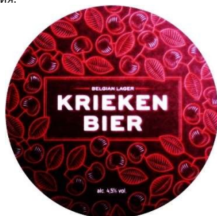
Cornelissen «Kriekenbier» КОРНЕЛИССЕН «КРИКЕНБИР»

Вишневое бельгийское пиво, сваренное на базе ламбика, пива спонтанного брожения с добавлением 25% вишневого сока, отборной вишни и трав в соответствии с традиционными рецептами. В результате уникального сочетания настоящего бельгийского пива и свежего вишневого сока получается сбалансированный освежающий напиток с приятным фруктовым вкусом и гладким слегка солодовым послевкусием. Аромат сладкий с нюансами спелой вишни, вишневой косточки и фруктовых леденцов. Пиво изготавливается исключительно из натуральных ингредиентов. Пивовары очень ответственно подходят к отбору вишни для пива. Высокое качество плодов является гарантом сложного вкуса, сочетающего умеренную сладость и приятные нотки вишневой косточки. Этот сорт пива прекрасен в качестве аперитива, либо дигестива. Сочетается с закусками, салатами, выпечкой и сладостями. Крепость 4.5%,